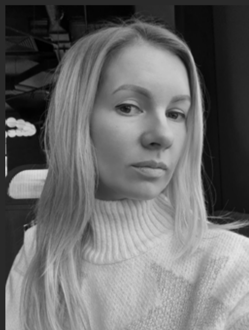
КАНДИДАТ ИСКУССТВОВЕДЕНИЯ, ЧЛЕН СОЮЗА ДИЗАЙНЕРОВ РОССИИ, РУКОВОДИТЕЛЬ МАГИСТЕРСКОЙ ПРОГРАММЫ «БРЕНДИНГ И ДИЗАЙН МЫШЛЕНИЕ», ДОЦЕНТ КАФЕДРЫ ГРАФИЧЕСКОГО ДИЗАЙНА И ВИЗУАЛЬНЫХ КОММУНИКАЦИЙ, РГУ ИМ. А.Н. КОСЫГИНА

Студенты «Кафедры графического дизайна и визуальных коммуникаций» ежегодно принимают участие в POPAI STUDENT DESIGN AWARDS. Конкурс на лучший дизайн-проект POSm – это и полноценная часть учебного процесса, и возможность получения практического опыта проектирования на основе реального брифа. К сожалению, пандемическая ситуация вносит свои коррективы, и второй год подряд не представляется возможным посетить производство или реализовать макеты в масштабе 1:1. Однако, погружение в профессиональную среду, возможность получения актуальной информации от представителей индустрии, анализ креативных проектных решений и творческий азарт – это становится для наших студентов не только ценным опытом, но и возможностью заявить о себе. От имени кафедры выражаю особую признательность одному из лидеров рынка POSm – компании VIRTU. Ваше всестороннее участие и информационное сопровождение так важно для молодых дизайнеров!