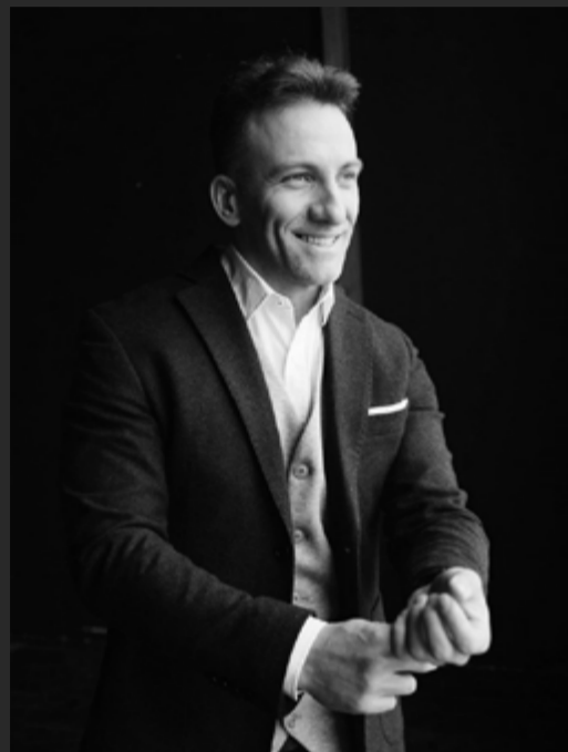
POSM DEVELOPMENT HEAD RUSSIA & CIS PERFETTI VAN MELLE

Все мы живем в быстро развивающемся мире. Изменения подчас так стремительны, что мы не успеваем осознать деталей и нюансов. Сейчас нам как никогда важно доносить до нашего потребителя очень понятные сообщения, которые будут прозрачны даже на уровне образов и форм.