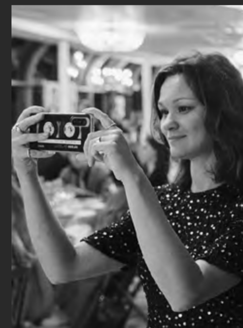
ДОЦЕНТ МГХПА ИМ. С.Г. СТРОГАНОВА ЧЛЕН МЕЖДУНАРОДНОЙ АССОЦИАЦИИ «СОЮЗ ДИЗАЙНЕРОВ»

В мире современного дизайн-образования ключевую роль играет возможность самореализации еще в процессе обучения. На мой взгляд, конкурс POPAI STUDENT DESIGN AWARDS из года в год предоставляет молодым специалистам уникальную возможность реализовать свой потенциал. Для молодых специалистов участие в конкурсе дает возможность составить представление о реальной дизайнерской деятельности, которое невозможно получить в стенах вуза, и почувствовать себя на одной ступени с уже реализовавшимися специалистами.