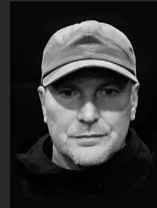
ОСНОВАТЕЛЬ И АРТ-ДИРЕКТОР ДИЗАЙН-АГЕНТСТВА REDIN

Приветствую вас, дорогие участники POPAI STUDENT DESIGN AWARDS! Спасибо за то, что находите в себе силы делать что-то новое, участвовать в конкурсе и реализовывать новые идеи. Ваши дизайн-решения – это всегда новый шаг не только для вас, но и для будущего.